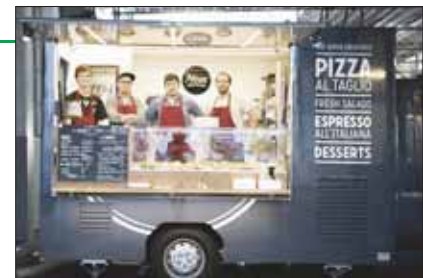
Le Foodtruck, un concept qui séduit.