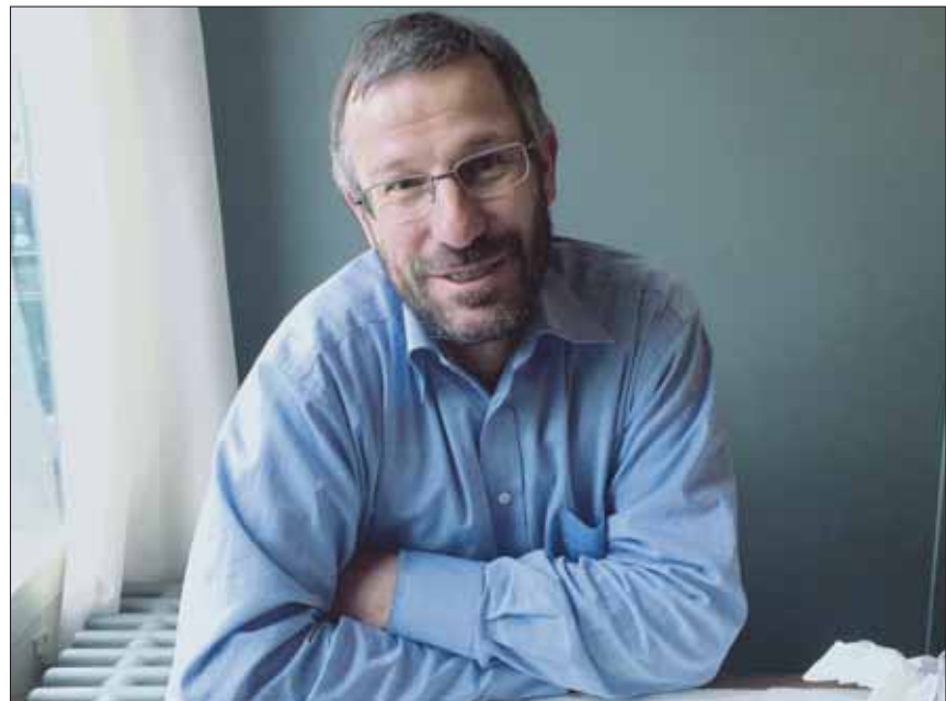
Yvan Droz, spécialiste en anthropologie religieuse.

Dans la représentation collective des années 30 par exemple, l'«ennemi» fantasmé était les Juifs. Aujourd'hui, les musulmans jouent le rôle de bouc-émissaire,