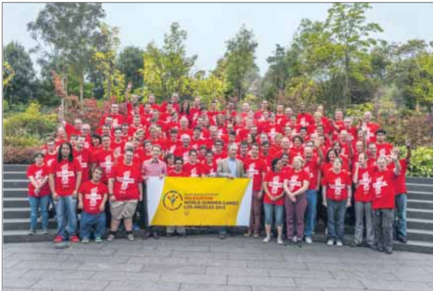
La délégation suisse va se préparer à Lausanne avant de partir à Los Angeles.

Les organisateurs souhaiteraient aussi qu'il soit l'occasion pour les Lausannois d'afficher leur fierté d'accueillir cette délégation. Une