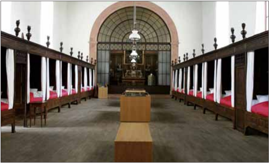
L’hôtel-Dieu Musée Greuze de Tournus.