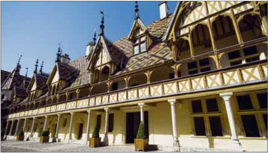
Les Hospices de Beaune.

fique apothicaire). Et que dire encore de l’abbaye Saint-Philibert, chef-d’œuvre de l’art roman et seul ensemble monastique du XIIe siècle conservé en Europe! ■