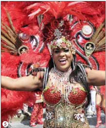
Toutes les photos de ces événements sont à découvrir sur www.lausannecites.ch