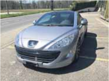
Peugeot RCZ 1.6 Turbo , 09.2010, 39'000 km, excellent état, expertisée 10.2014 Fr. 19'800.- Tél. 079.248.25.11