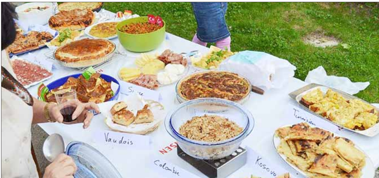
La Fête des voisins, pour partager et découvrir dans la bonne humeur.

Pour mettre en valeur le rôle des commerçants de proximité dans la qualité de vie des quartiers, et pour la première fois également,