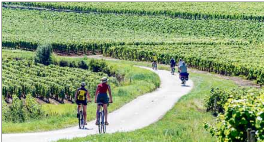
A vélo dans le vignoble.

AB • Facile de repérer la route des très grands vins de Bourgogne, ils sont dans tous les guides! En quittant Dijon, plus de 100 km sont balisés sur la Route des Grands Crus puis la Route des Grands Vins. Il est possible de visiter nombre de maisons célèbres ou moins connues, mais... seulement de regarder le tout petit vignoble (1,77 ha) de Romanée-Conti. On peut essayer une tout autre approche à Beaune avec le Marché aux Vins, dans l’ancienne église des Cordeliers. Plusieurs types de dégustations sont possibles, dont des grands crus. Et comme l’art et le vin sont intimement liés, la galerie d’art contemporain Robert Bartaux y présente de nombreux grands artistes. Pourquoi ne pas déjeuner au cœur d’un vignoble? Le Château de Chamirey (à Mercurey) a ouvert une magnifique table d’hôtes et propose les vins des différents domaines de cette propriété de la Famille Devillard.