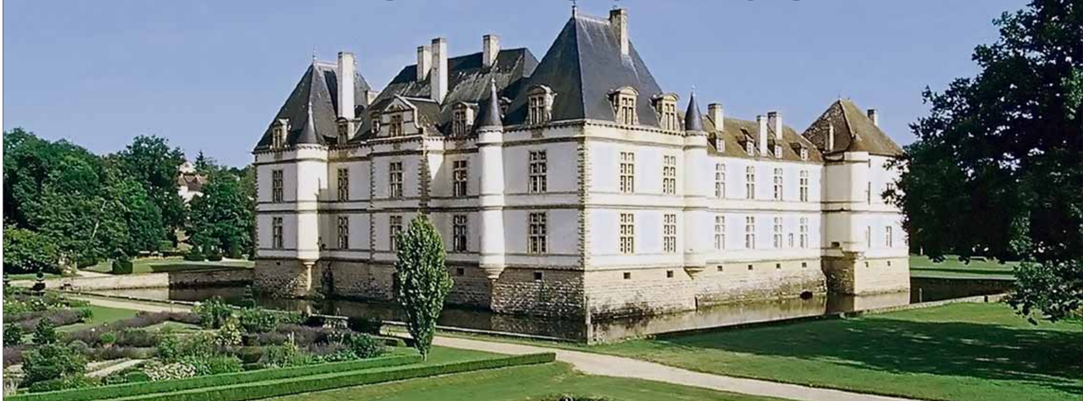
Le château de Cormatin.

SENSATIONS • De la Côte d’Or à la Saône-et-Loire, la capitale des Ducs de Bourgogne, les petites villes d’art et d’histoire, les châteaux et la gastronomie délivrent encore des secrets entre vignes, Saône et canaux.