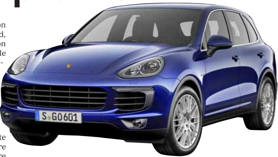
Porsche, un véritable savoir-faire.

Passion et raison Il n'est pas étonnant que le Cayenne soit le modèle le plus vendu de la marque. Mettez quelqu'un d'intéressé au volant, ce sera déjà la moitié de la vente effectuée. Ce succès va peut-être lui être contesté par le petit frère Macan, diablement tentant. Outre les performances du moteur, il convient de relever l'exploit qui consiste à contenir la consommation à 8,5 l/100 km pour un test qui a mélangé les genres de trajets. Avec un poids de 2215 kg, il faut le faire! Les qualités dynamiques sont proprement stupéfiantes. Le châssis a été conçu comme un ensemble sportif. Il peut parfaitement affronter les terrains les plus sca-